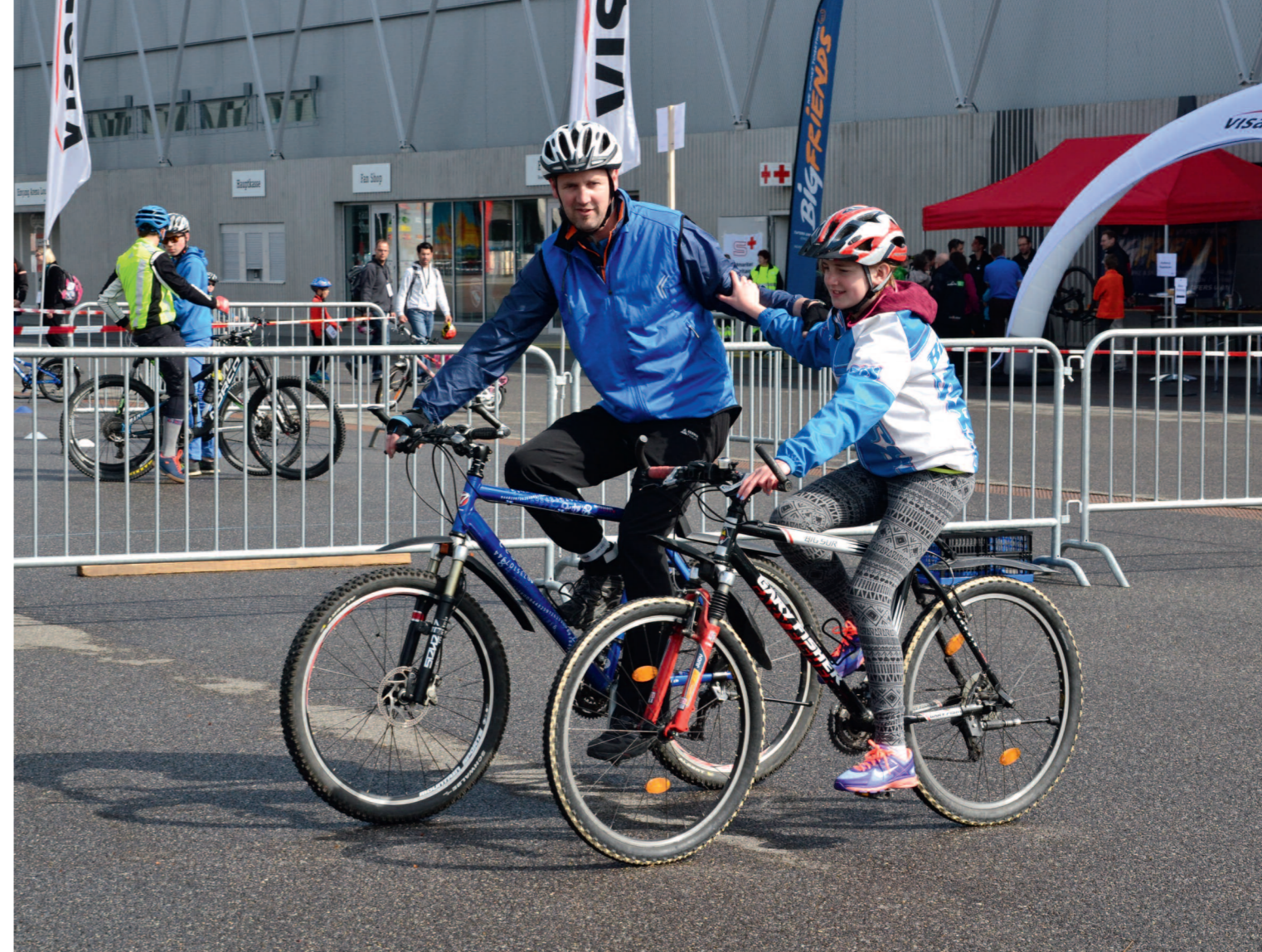
Mehr Fahrkompetenz für die ganze Familie.